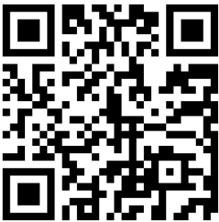
筑西市電子図書館